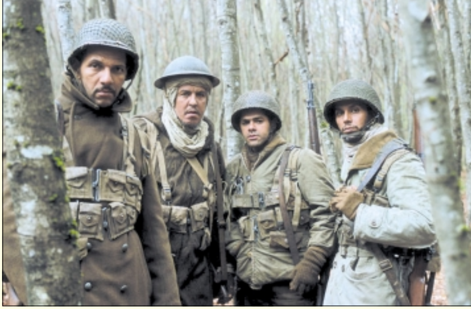
مشهد من فيلم الافتتاح.